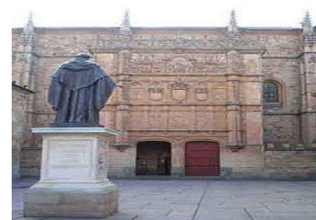
Fachada da Universidade de Salamanca

Pequeno-almoço no hotel. Partida para a Ciudad Rodrigo (8h30). Visita guiada à cidade (10h00). Almoço Livre. Regresso a Lisboa com paragem em Coimbra