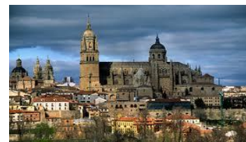
Vista da Cidade – Catedral de Salamanca