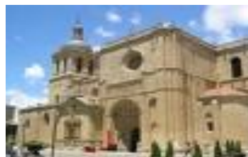
Catedral da Ciudad Rodrigo

Para mais informações: proinclusao.com.sapo.pt