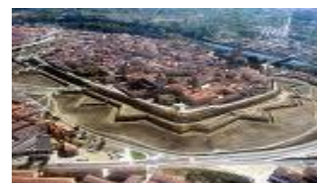
Vista aérea da Ciudad Rodrigo